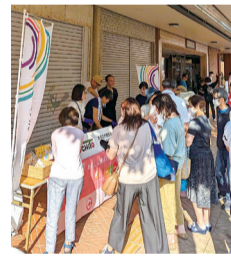
さかた北前朝市に出店している様子

れしいことに、出店する度に多くの地域の方が立ち寄ってくれるんです。猪股・・・庄内地域でどんどん輪を広げていき、多くの方々に配達拠点のTOCHITOに立ち寄ってもらえる日がきたらうれしいですね。生活クラブの認知度を上げていきたいです。