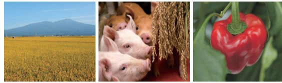
庄内地域の消費材には、米、豚肉、パプリカのほか、多数の食材や飲料もあります

生活クラブと提携生産者、酒田市は包括連携協定を締結。「TOCHiTO」プロジェクトが始動しました。さまざまな検討を経て、2023年6月に「TOCHiTO」がオープン。庄内地域で、暮らしに欠かせない食・エネルギー・福祉を自給し自治できることをめざして、さらなる新たな展開がはじまっています。