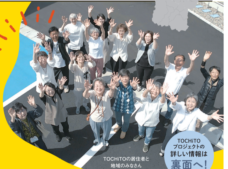
TOCHITOの居住者と地域のみなさん

生活クラブが山形県庄内地域の酒田市と連携してすすめている、「住まい」+「地域と交流する場」の機能をつくる「TOCHITO」プロジェクト。「居住棟・TOCO」と移住者も地域の方も利用できる「交流棟・COTO」のオープンから早半年。TOCHITOで暮らす居住者のみなさんは、庄内地域で思い思いの時間を過ごしています。移住したみなさんに、いまの暮らしや仕事、これからチャレンジしてみたいことを聞きました。