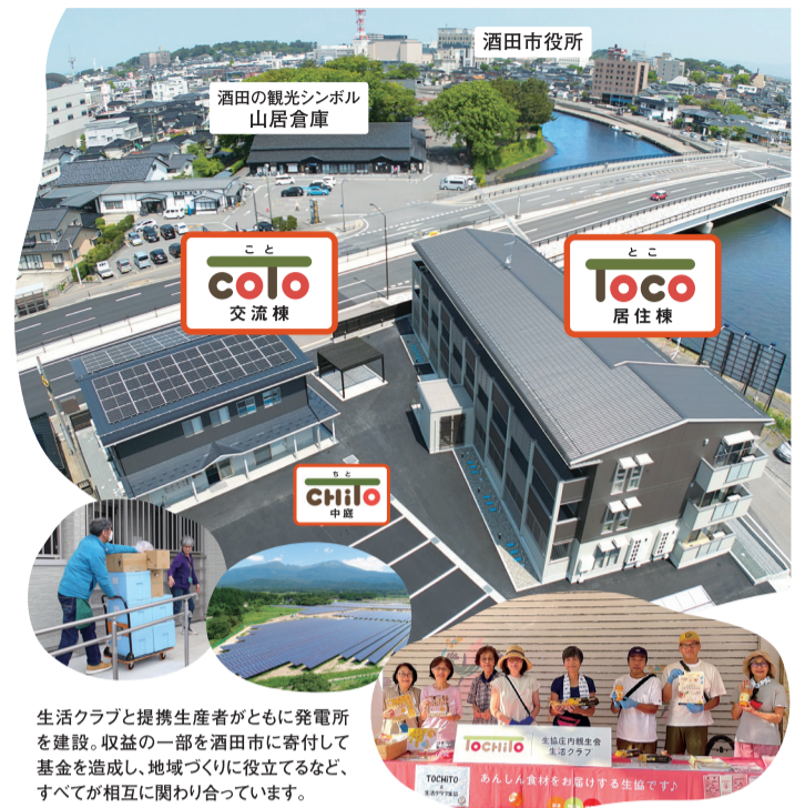
生活クラブと提携生産者がともに発電所を建設。収益の一部を酒田市に寄付して基金を造成し、地域づくりに役立てるなど、すべてが相互に関わり合っています。